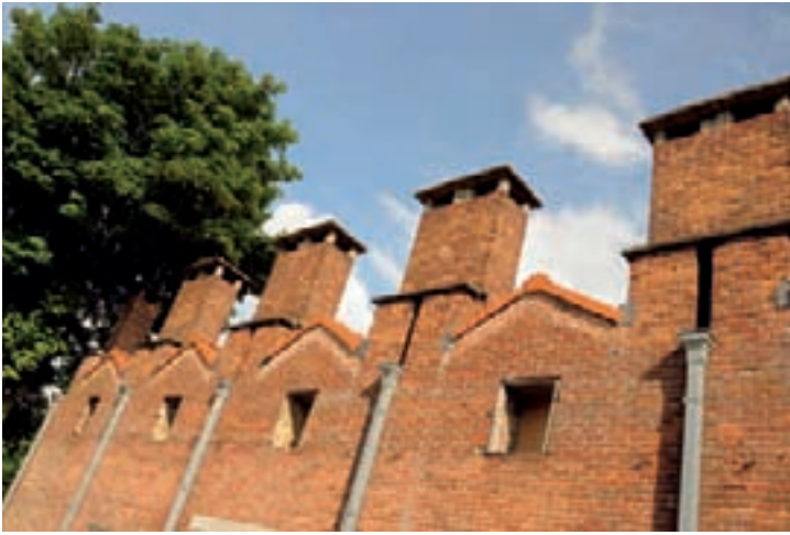
Renovatie van de oude steenbakkerij van Boom tot woning, architecten Verdickt & Verdickt

Zondag 25 mei waren tienduizenden kandidaat-verbouwers op de been, om een bezoek te brengen aan de meer dan 120 opengestelde renovatieprojecten in alle uithoeken van België. Bij ieder renovatieproject konden de bezoekers rekenen op de warme ontvangst van de bouwheer en de architect. Tijdens De Renovatiedag is men als